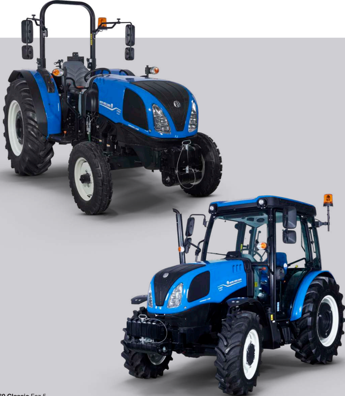
TT60 Classic Faz 5

Yeni New Holland TT60 Classic; yenilenen tasarımı, daha güçlü ve çevreci motoruyla, çiftçilerimiz tarafından en çok tercih edilen serilerden biri olan TT serisine eklenmiştir. Yerli S8000 motoru, 55 HP motor gücü ve 258 Nm maksimum tork değeri ile öne çıkan TT60 Classic serisi; çift çeker ve tek çeker seçeneklerinin yanı sıra, kabinli ve ropslu alternatifleriyle de çiftçilerimizin beğenisine sunulmaktadır.