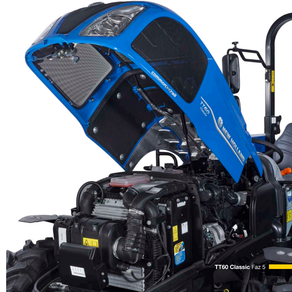
TT60 Classic Faz 5