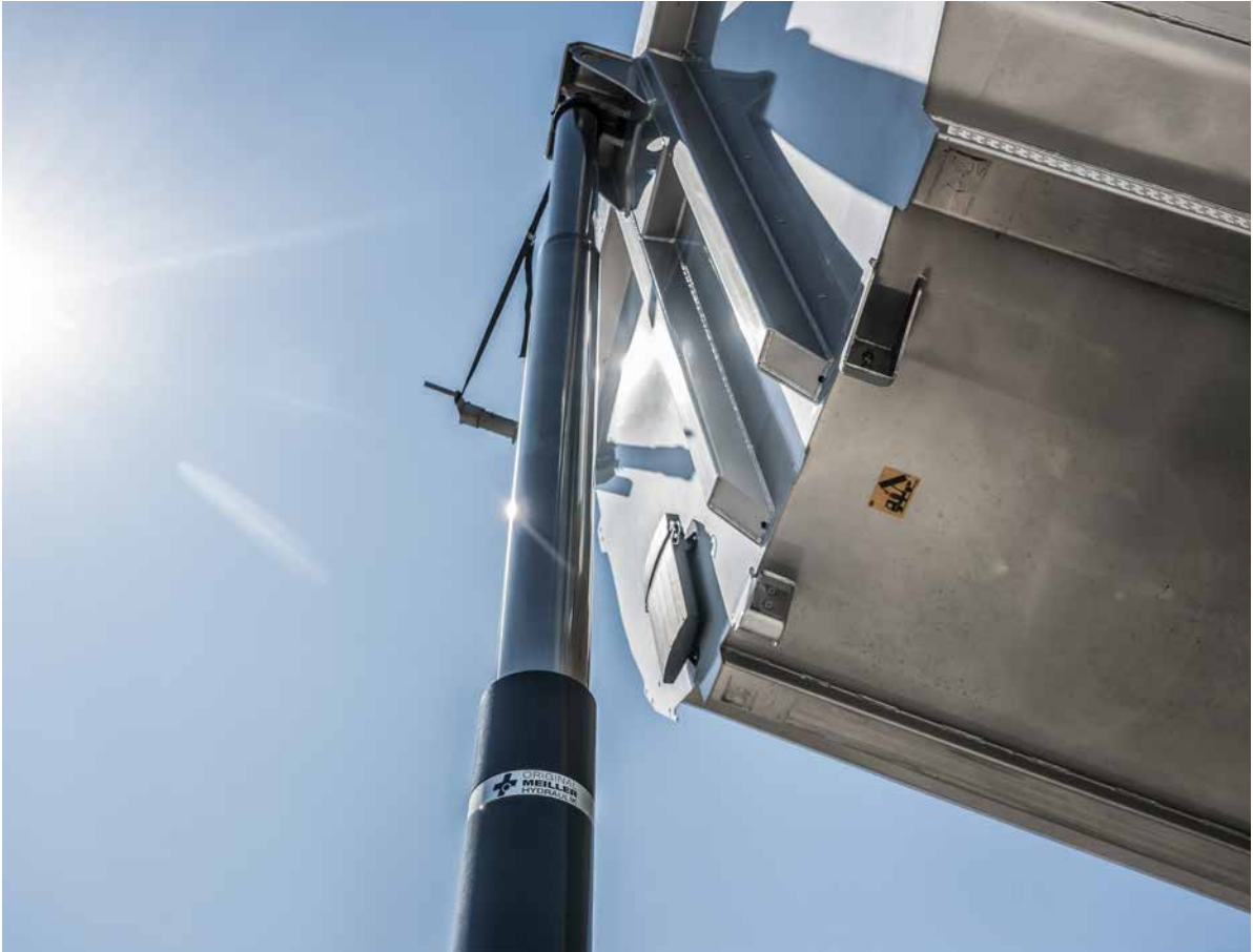
MEILLER Hydraulik: Kraftvoll. Ausdauernd. Effizient.