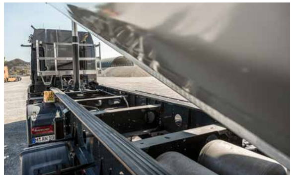
Biege- und torsionssteifer MEILLER Fahrwerksrahmen