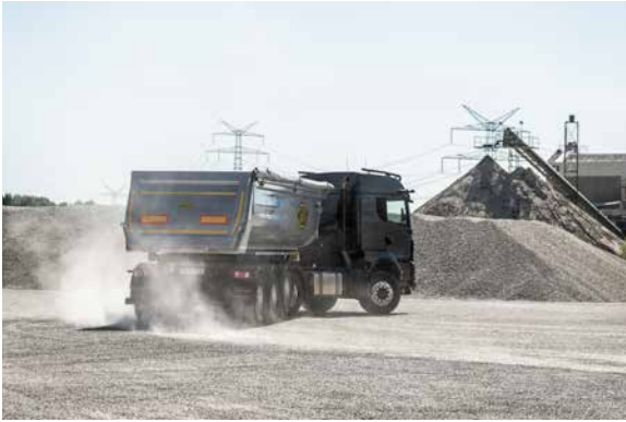
Für den Transport von Schüttgütern