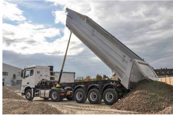
... bis zur Baustelle.